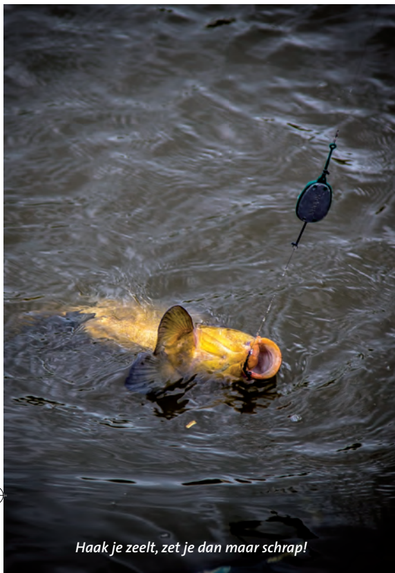
Haak je zeelt, zet je dan maar schrap!

de kant geschepte vis te sorteren en terug te gooien in het water. Maar ja, de arbeidskosten zijn tegenwoordig te hoog. In deze soort sloten kan je ook goede vangsten behalen door de klassieke harkmethode toe te passen. Je maakt een strook vrij van waterplanten met behulp van een traditionele tuinhark en ga dan daar vervolgens vissen. De waterplanten zijn ontworteld en de omgewoelde bodem lokt zeelt om een kijkje te gaan nemen en gaat op zoek naar de vrijgekomen wormen.