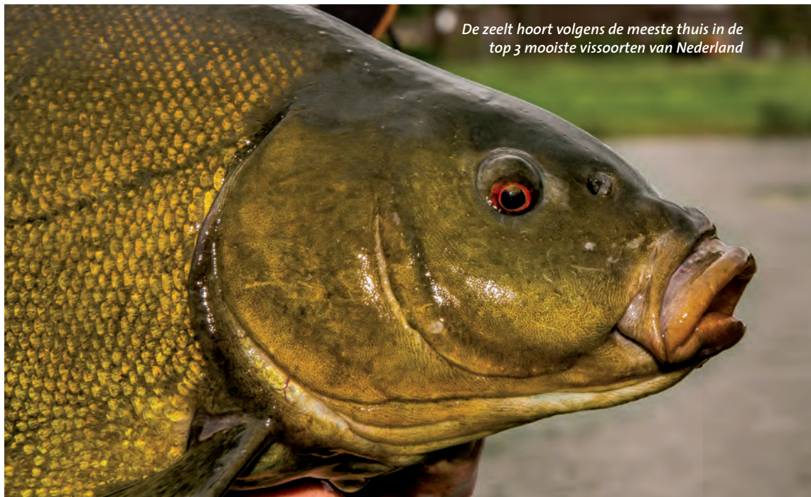
De zeelt hoort volgens de meeste thuis in de top 3 mooiste vissoorten van Nederland

water en een hoge zuurgraad; zelfs in veenpoelen kan hij overleven. Daarmee is de vis redelijk bestand tegen organische vervuiling. Weggekropen in modder of leem of dicht tegen elkaar aan, in scholen vlak boven de bodem, brengen zeelten de winter door. De zeelt is een verlegen vis die zich bijna altijd schuil zal houden tussen de beplanting. De zeelt zit bijna altijd op de bodem. De lengte van een zeelt is maximaal 70 cm.